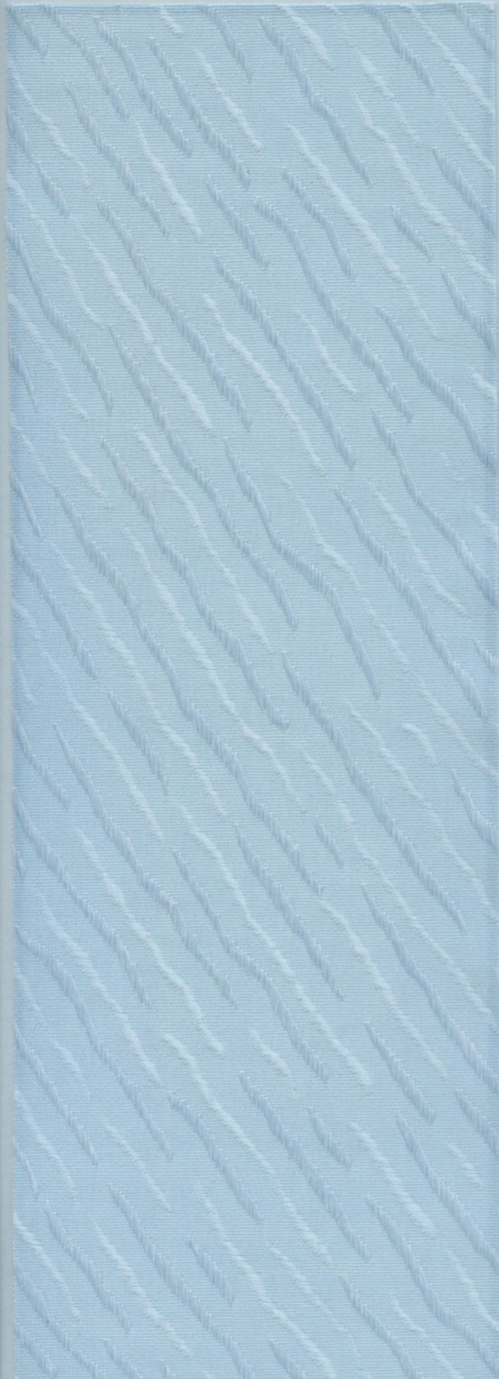
4408 POWDER BLUE